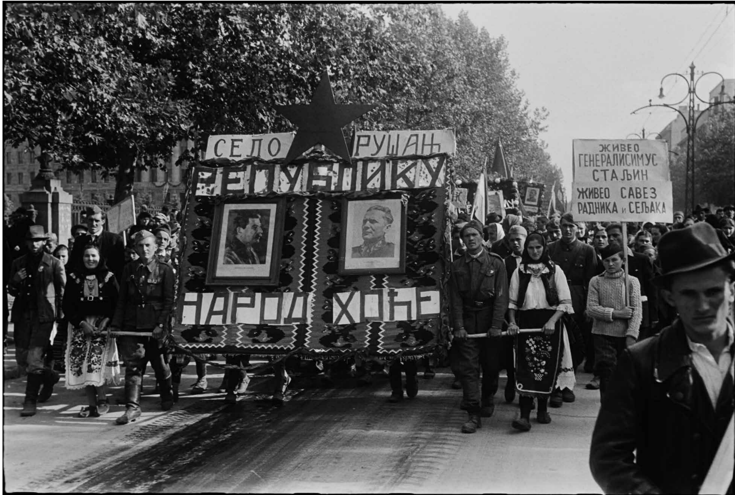
Beograd u danima neposredno posle oslobodenja, oktobar 1944. Belgrade in the days immediately after the liberation, October, 1944